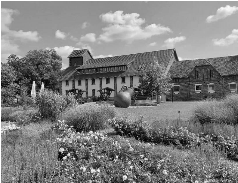
Abbildung 3 Gut Geisendorf

wir im Lausitzer Revier gemeinsam mit dem Ring Deutscher Bergingenieure e.V. und dem Traditions- und Förderverein Schwarze Pumpe e.V. an wechselnden Orten durchführen, ist gegeben ( in