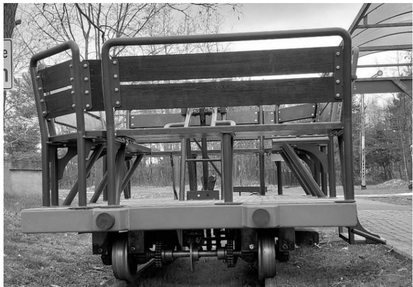
Abbildung 4 unsere Draisine

Jedoch können wir im kommenden Jahr 2024 nicht mehr auf alle erfahrenen Draisinenfahrer zurückgreifen. Sie werden zukünftig den wohlverdienten Ruhestand genießen. Wir suchen deshalb interessierte junge und ältere Menschen,