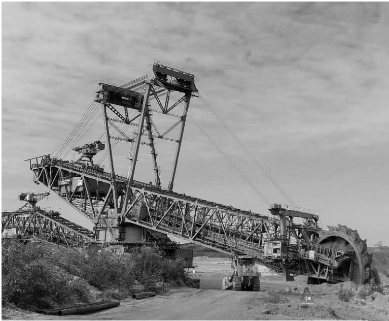
Abbildung 2 SRs 6300

durchgeführt werden. Die Befahrung führte beginnend bei der neuen Kohle-verladung, über den Grubenbereich, der Förderbrücke F60, dem Vorschnittbagger SRs 6300