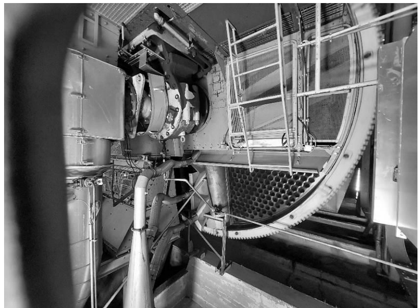
Abbildung 1 Röhrentrockner

Beschäftigten der Energiefabrik die Brikettfabrik Mitte in Schwarze Pumpe in 2 Etappen befahren.