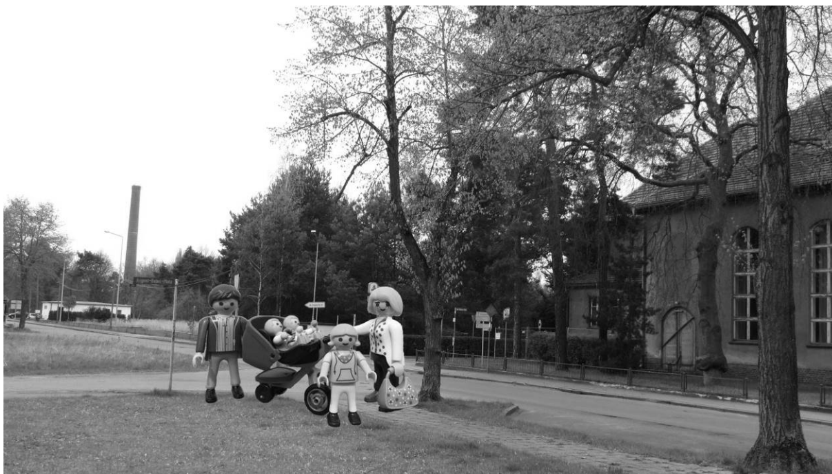
Abb. Bauplatz gesucht. Derzeit entscheiden Stadt- und Ortsrat über neue Bauflächen im Ortsteil Knappenrode. Gestalterisch sollen die neuen Bauten sich in das Bild der Werkssiedlung Knappenrode einfügen. Dazu werden nun auch Entwurfswerkstätten angeboten.

Doch die Baufelder sind knapp an der Zahl. Derzeit gibt es nur noch vier Grundstücke zu vergeben. Ein Besuch lohnt also allemal. So können Sie die Vertreter der Stadt Hoyerswerda und Knappenrodes direkt sprechen und sich persönlich für eine Baufläche bewerben oder gar entscheiden.