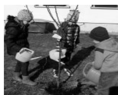
Das Team der Kita Wirbelwind